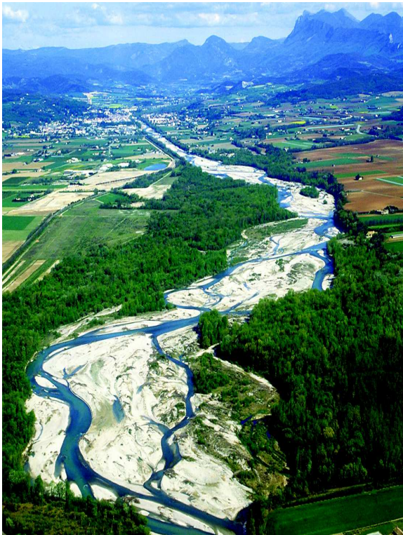
Schéma de Cohérence territoriale (SCoT) de la Vallée de la Drôme Aval

Le Schéma de Cohérence Territoriale , le «SCoT», est un document d'urbanisme qui définit les grandes orientations d'aménagement du territoire pour les 15 ans à 20 ans à venir dans les domaines suivants : Economie, Tourisme, Agriculture, Mobilité-Transport, Energie, Environnement et Habitat-Urbanisme.